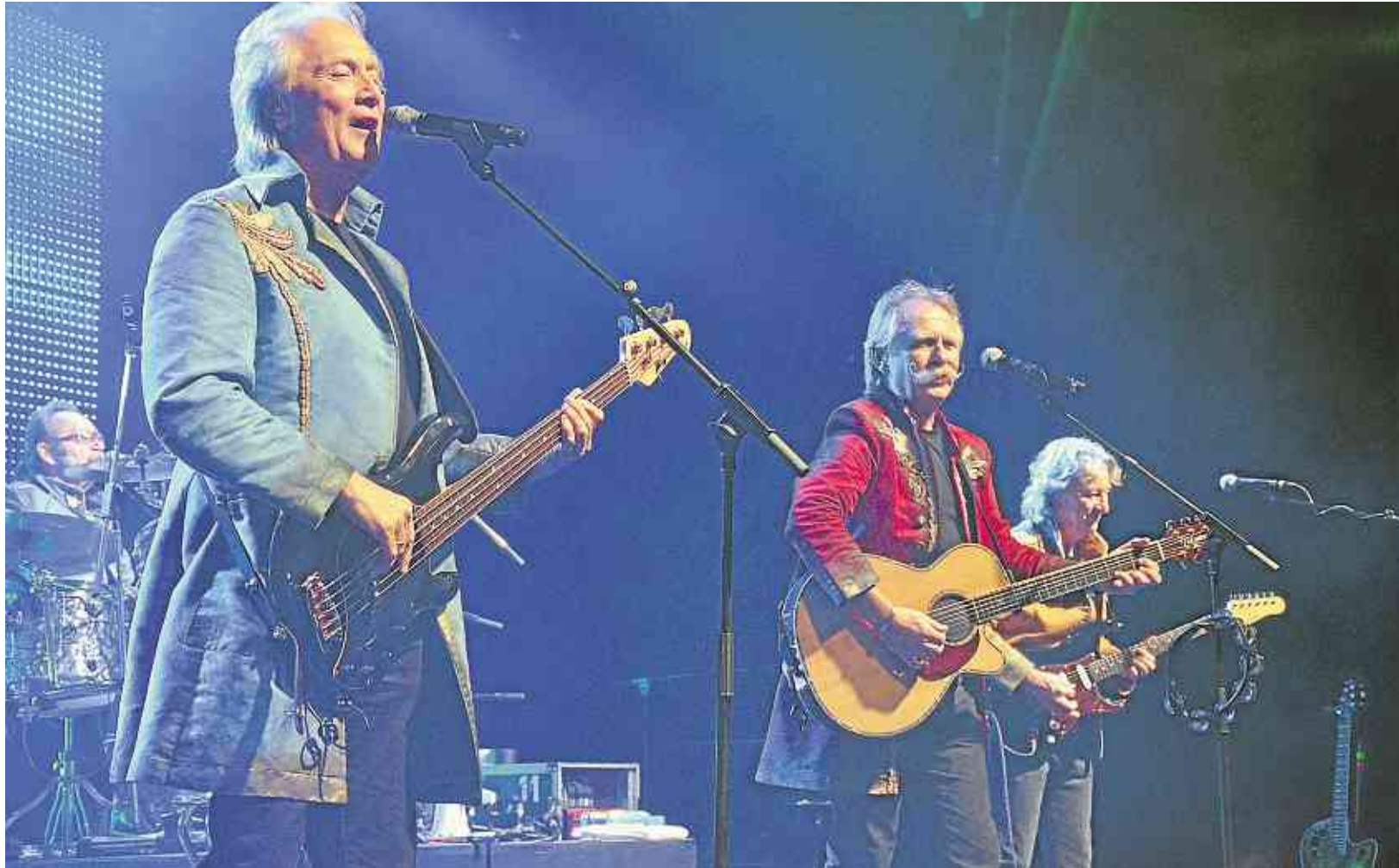
Auf Einladung des Kulturwerks und der Wissener Eigenart machten „Die Höhner“ auf ihrer Tournee 2015 Station in Wissen.

Cinexx Nisterstraße 4a, Telefon 02662/945 050, www.cinexx.de Asterix im Land der Götter (15.15 Uhr). Cinderella (14.30, 15, 16.30, 17, 19 Uhr). Der Nanny (ab 6 Jahren) (14.30, 17, 20 Uhr). Die Bestimmung – Insurgent (ab 12 Jahren) (20.15 Uhr). Fast & Furious 7 (ab 12 Jahren) (14, 17, 20 Uhr). Fifty Shades of Grey (ab 16 Jahren) (20 Uhr). Home – ein smektakulärer Trip (15, 17.15 Uhr). Kingsman: The Secret Service (ab 16 Jahren) (19.30 Uhr). Shaun das Schaf – Der Film (15, 17 Uhr). Traumfrauen (ab 12 Jahren) (17.30 Uhr).